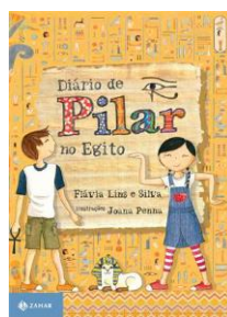
Diário de Pilar no Egito Flavia Lins e Silva Ed. Zahar

TODOS OS ALUNOS RECEBERÃO GRATUITAMENTE AGENDA ESCOLAR DA COEDUBA QUE DEVERÁ SER UTILIZADA DURANTE ANO LETIVO DE 2019.